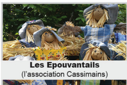
Les Epouvantails (l'association Cassimains)