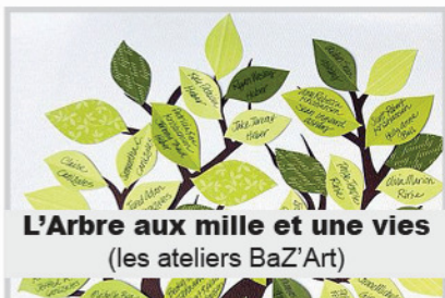
L'Arbre aux mille et une vies (les ateliers Baz'Art)