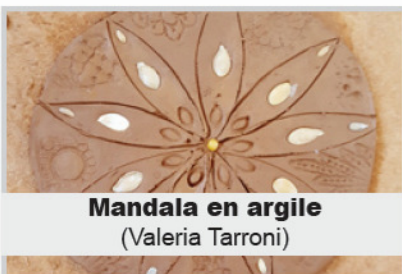
Mandala en argile (Valeria Tarroni)