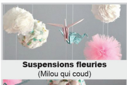
Suspensions fleuries (Milou qui coud)