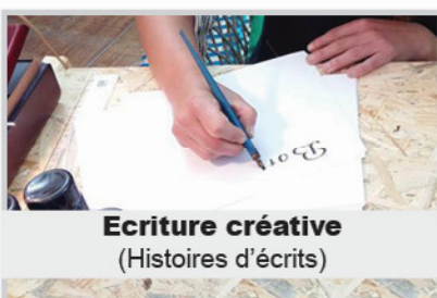
Ecriture créative (Histoires d'écrits)